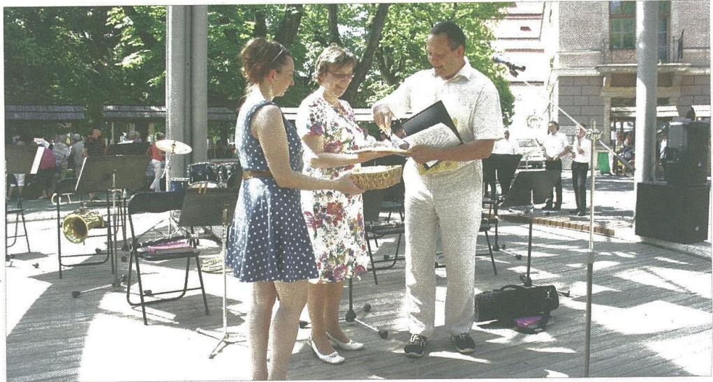
Slávnostné otvorenie a následný krst publikácie hoblinami.

Mestský park v Levoči dňa 11. 6. ožil hudbou, spevom, tancom, ľudovým slovesným umením a tradičnými remeslami. Podujatie pripravené zo strany MAS LEV a MAS Šafrán v spolupráci s mestom Levoča otvorilo vďaka projektu národnej spolupráce „Po stopách klenotov LEV-a a Šafránu“ letnú turistickú sezónu.